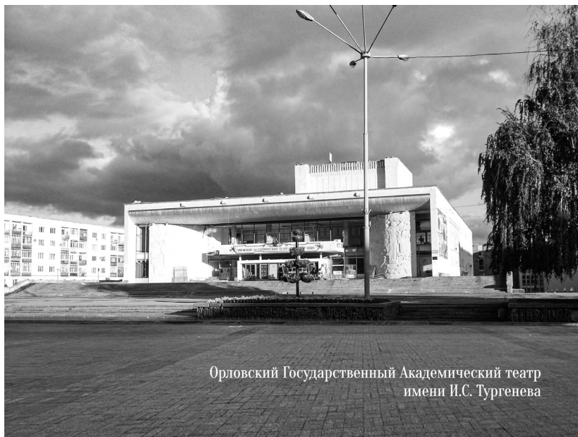
Орловский Государственный Академический театр имени И.С. Тургенева